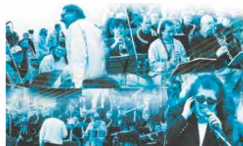
SNAP UP BIG BAND

■ Via Papa Giovanni XXIII Notte d'estate fra balletto, modern e fantasia a cura del Centro Danza Buratto