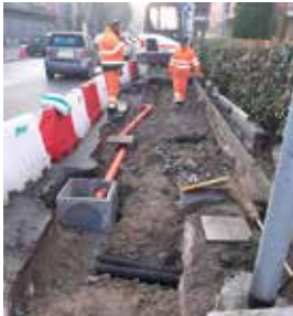
Il cantiere su Via Risorgimento

■ Dopo l'intervento di messa in sicurezza del ponte di Via Roma, proseguono gli interventi da parte di Autostrade per mettere a norma i nostri cavalcavia. Ci rendiamo conto dell'inevitabile disagio che ciò arrecherà ai residenti delle frazioni coinvolte, ma sul tema della sicurezza non ci possono essere indugi. L'intervento sul ponte di Via A. Masini, iniziato lo scorso 24