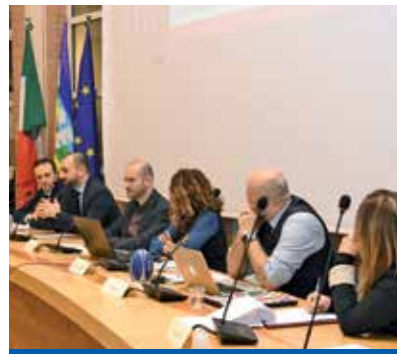
Assemblea generale Spazio Comune del 15 gennaio

Con il Documento Unico di Partecipazione, Zola dà concreta e piena attuazione al principio di sussidiarietà orizzontale dettato dall'art. 118 della Costituzione laddove si prevede che i "Comuni favoriscano l'autonomia iniziativa dei cittadini, singoli e associati, per lo svolgimento di attività di interesse generale". Siamo convinti, però, che al coinvolgimento del privato nella gestione dei beni comuni non possa corrispondere un mero arretramento dell'Amministrazione in quanto il ruolo dei soggetti pubblici nel garantire i diritti civili e sociali riconosciuti dalla Costi-