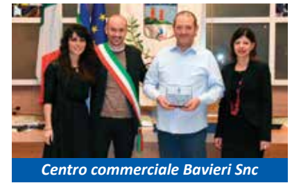
Centro commerciale Bavieri Snc