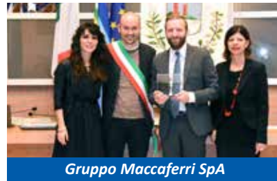
Gruppo Maccaferri SpA