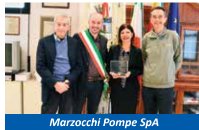
Marzocchi Pompe SpA