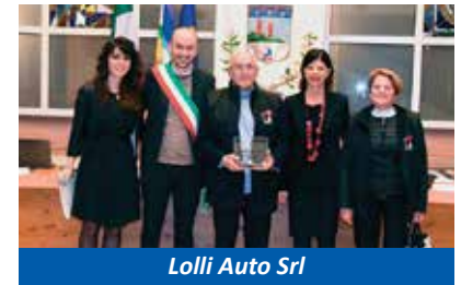
Lolli Auto Srl