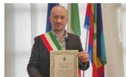
Il Sindaco con la pergamena per la Senatrice Segre

E anche il tema dell' abbandono dei rifiuti , che spesso emerge sui nuovi social, va affrontato col medesimo piglio. Qualcuno sostiene che le difficoltà prodotte in alcuni casi dall'attuale sistema di raccolta induce gli abbandoni, e fare multe è una via discutibile (per non dire sbagliata) perché colpisce l'effetto, anziché agire sulla causa. Ebbene, per fare un esempio, sarebbe come dire che in una zona carente di parcheggi, prima di sanzionare per divieto di sosta bisognerebbe farne dei nuovi. Ma nel frattempo? Accettare la sosta selvaggia come contrappasso? Magari anche quella che nonostante posti liberi sceglie il luogo semplicemente più comodo anche se non idoneo? Perché se il divieto c'è deve valere per tutti, o per nessuno. Ecco, questo sarebbe, ancora una volta,