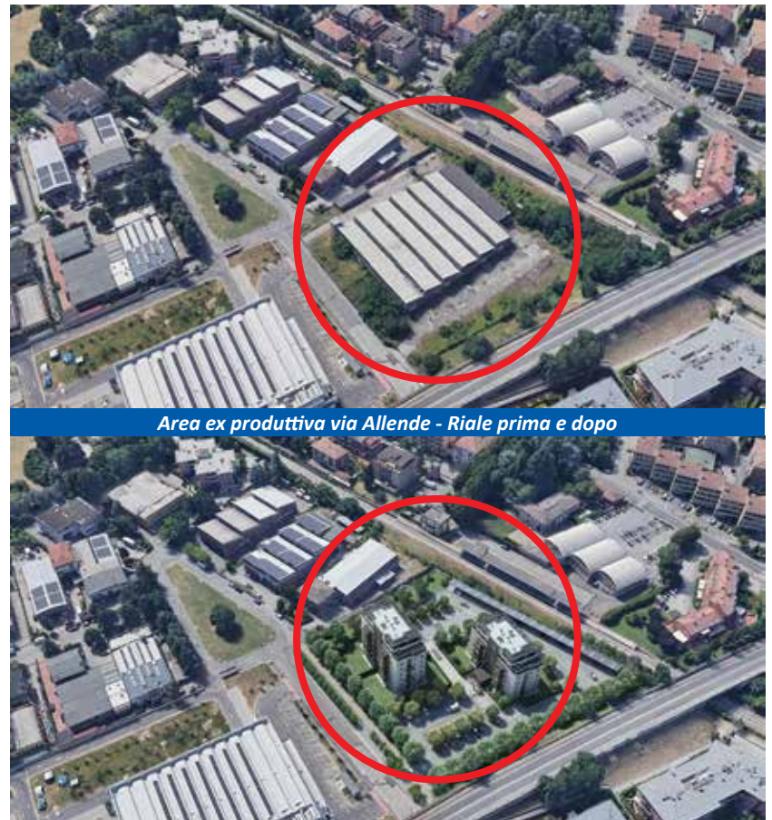
Area ex produttiva via Allende - Riale prima e dopo

Presupposti pressoché analoghi sono riscontrabili nell'intervento previsto in Via Allende a Riale che ha già ricevuto il via libera del Consiglio Comunale all'unanimità. Anche in questo caso, l'area è attualmente caratterizzata da un edificio ex produttivo completamente in stato di abbandono, in un ambito caratterizzato da tessuti edificati per funzioni miste in cui gli strumenti di pianificazione mirano a programmare azioni di riqualificazione e rigenerazione urbana. La superficie del lotto è di circa 11.500 mq di cui il 46% verrà ceduto al Comune che, per 3.214 mq, lo adibirà a verde pubblico (oltre a 808 mq di parcheggio pubblico) . Con la partecipazione privata si