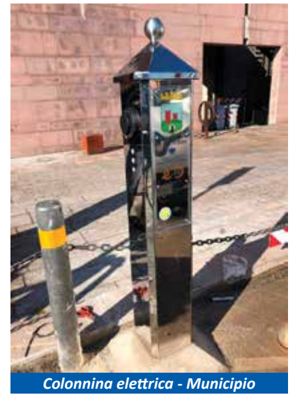
Colonnina elettrica - Municipio

■ Creazione di un legame tra le Scuole del territorio e le aziende agricole , con iniziative atte alla diffusione e alla conoscenza del nostro territorio e dei suoi prodotti enoga-