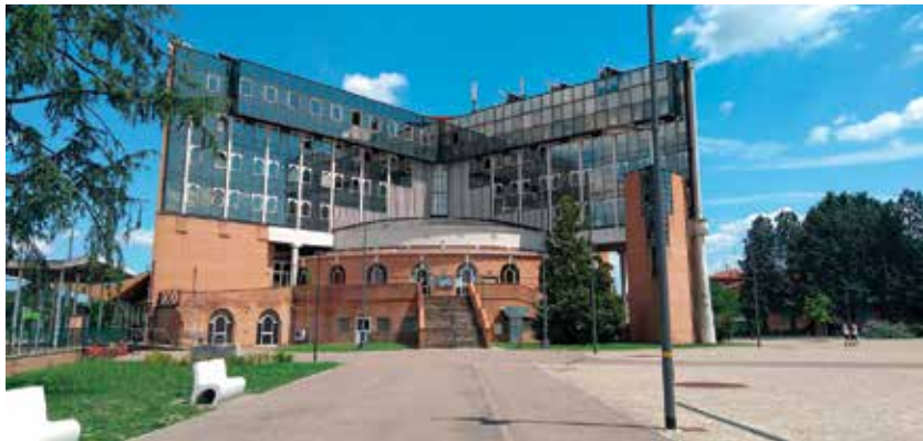
La nuova piazza vista Municipio