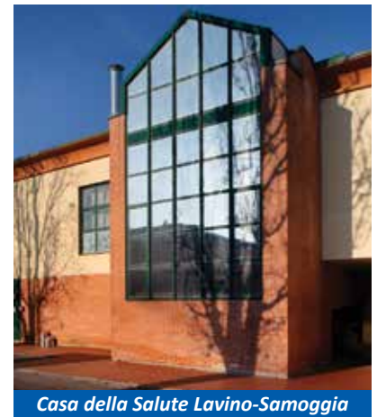
Casa della Salute Lavino-Samoggia

Quanto all' edilizia scolastica - oltre alla ferma volontà di continuare ad investire sulla messa in sicurezza, manutenzione e potenziamento delle strutture destinando annualmente una quota specifica del bilancio - l'obiettivo è il completamento dell'asilo nido del quartiere Zola Chiesa, l'ampliamento degli spazi parcheggio nell'area del complesso scolastico di Ponte Ronca e la