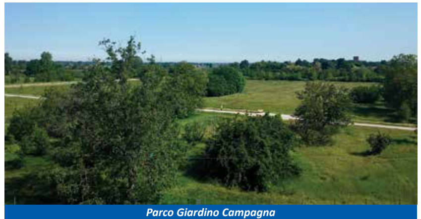
Parco Giardino Campagna

■ la messa in relazione dei centri abitati attraverso la proposta di un progetto su tutto il territorio di una rete integrata di percorsi pedonali e ciclabili;