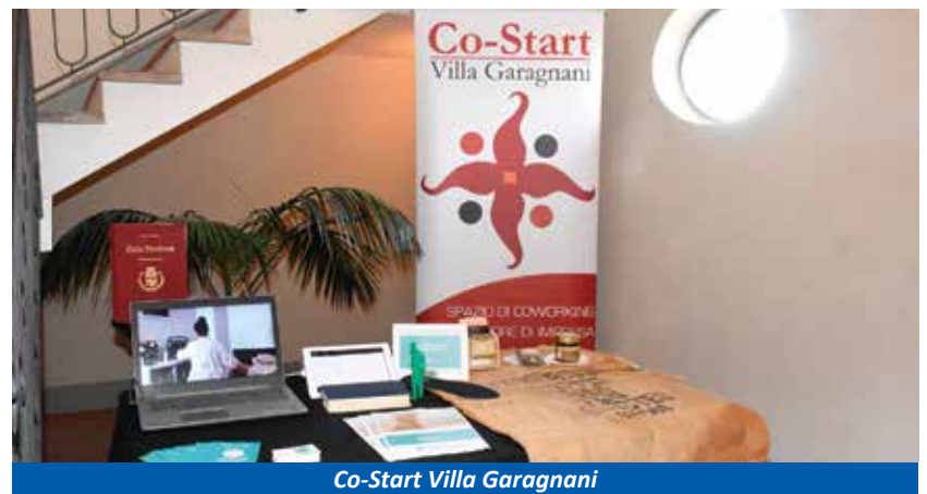
Co-Start Villa Garagnani

Nessuna sicurezza può, però, essere garantita a scapito della libertà. Il problema del rispetto delle regole è soprattutto una questione culturale, è convincimento, condivisione, si basa su un sentire comune, su una volontà comune. In questo senso quindi, vogliamo implementare le azioni di sensibilizzazione e di educazione che contribuiscono a favorire senso civico, coesione della Comunità e quindi maggior presidio sociale del territorio anche con l'ausilio delle nuove tecnologie e di strumenti di "controllo di vicinato" .