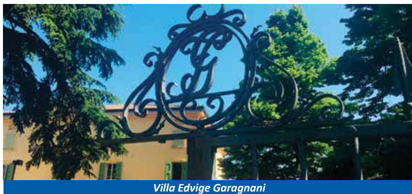
Villa Edvige Garagnani

In un mondo dove le relazioni fra le persone sono in crisi, in cui prevalgono l'individuali-