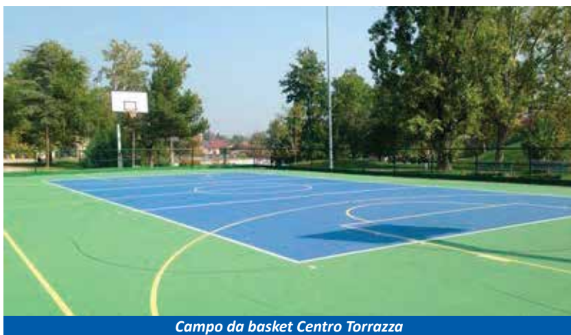
Campo da basket Centro Torrazza