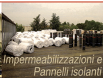
Impermeabilizzazioni e Pannelli isolanti