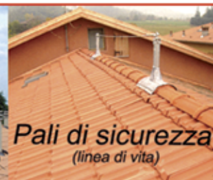
Pali di sicurezza (linea di vita)

Via Theodoli, 2 - Zola Predosa (BO) - Cell. 333 6307666 - www.marcone.191.it - mab_sas@hotmail.it - mabsas@cgn.legalmail.it