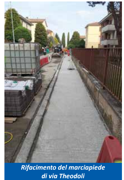
Rifacimento del marciapiede di via Theodoli

Abbiamo circa 135 Km di strade comunali asfaltate nel nostro territorio.