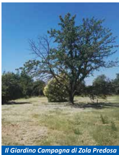
Il Giardino Campagna di Zola Predosa