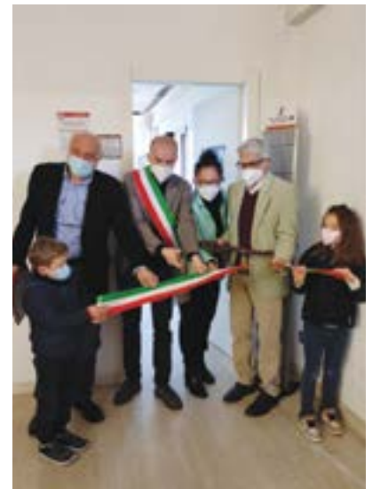
L'inaugurazione dello Sportello Vittime

Sportello Vittime di Zola Predosa Municipio - P.zza della Repubblica, 1: tel: 051/6161637 E-mail: centrovittimezolapredosa@gmail.com apertura: venerdì dalle ore 9 alle ore 12.