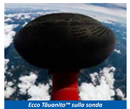
Ecco Tāuanito™ sulla sonda