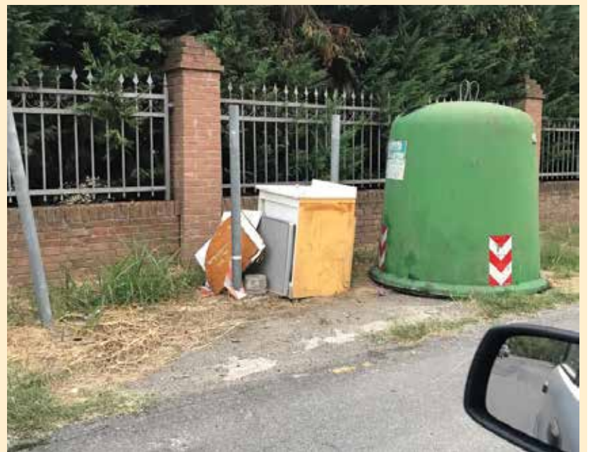
Lavatrici e lavastoviglie sono apparecchiature elettroniche che vanno portate presso la stazione ecologica. Se funzionanti, perché non portarle in un mercatino dell'usato?"