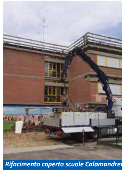
Rifacimento coperto scuole Calamandrei

Alcuni interventi sono risultati ben visibili