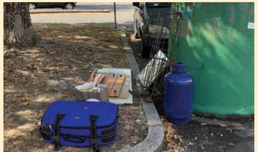
La bombola del gas non deve essere abbandonata accanto alle campane dei rifiuti, ma conferita presso il rivenditore dove l'avete acquistata. Le valigie non si abbandonano ma si portano alla stazione ecologica. È tutto gratis.