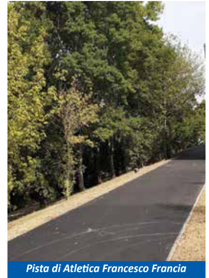
Pista di Atletica Francesco Francia

al rientro in classe, mentre altri saranno probabilmente poco evidenti ma allo stesso modo importanti e necessari. I lavori,