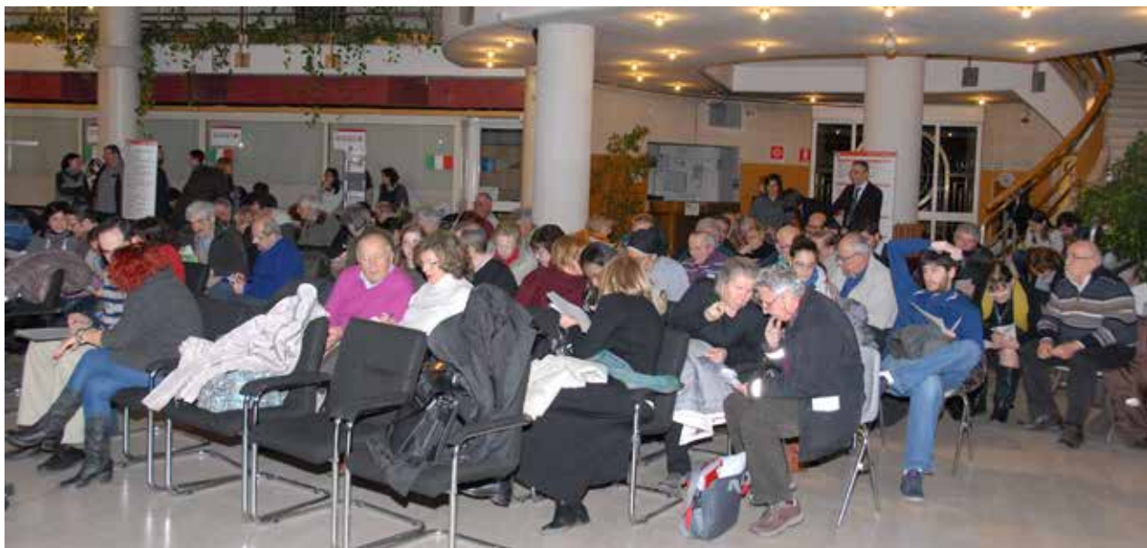
RI-GENERAZIONI PARTECIPATE: 29 GENNAIO 2015 LA PRESENTAZIONE DEL PROGETTO

Cogliendo l'opportunità di collaborare con i Comuni di Casalecchio di Reno e Monte San Pietro, con Asc Insieme e con