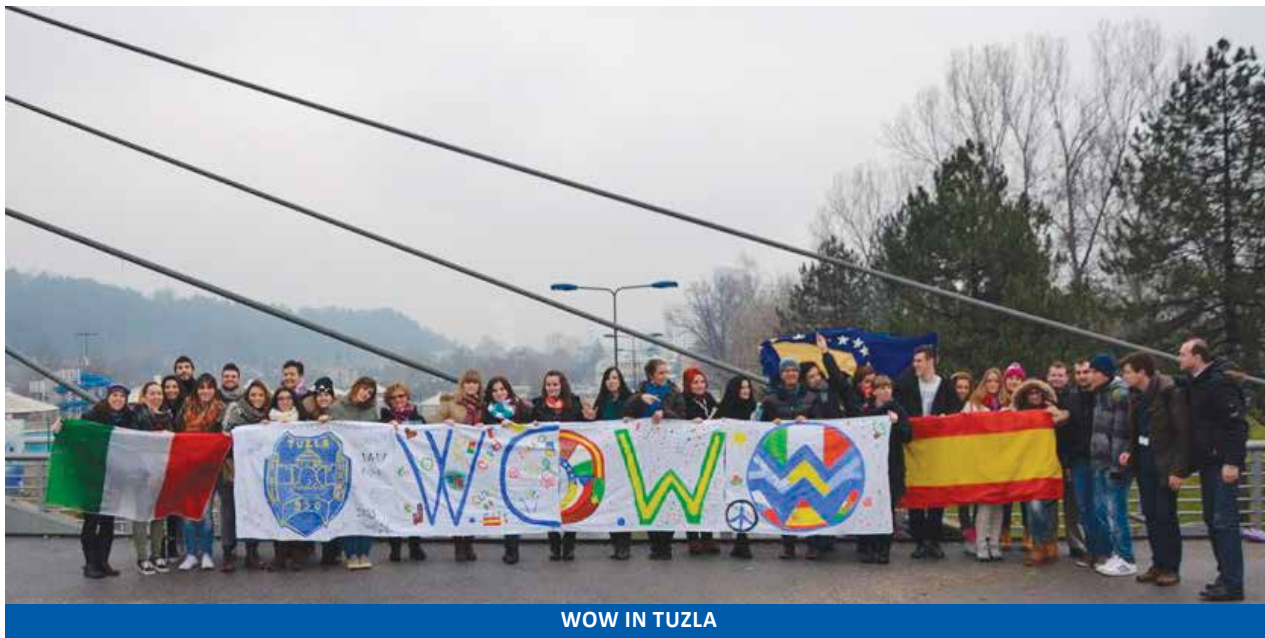
WOW IN TUZLA

Dopo oltre un anno di lavoro che ha coinvolto direttamente circa 120 giovani tra i 15 e 29 anni, provenienti da Istituti superiori e Università di 5 paesi, tra il 6 e il 9 maggio prossimi, l'allegria carovana di WOW si incontrerà in Italia tra Zola Predosa, Casalecchio di Reno e Valsamoggia. Sarà il momento per tirare le fila delle attività svolte dai diversi partner e in occasione dei precedenti meeting internazionali. Sarà una ulteriore opportunità di incontro e confronto sui temi della cittadinanza europea, del dialogo interculturale e dell'integrazione. Sarà il momento per definire i contenuti del Vademecum della cittadinanza inclusiva e di un DVD che racconterà come questa esperienza concreta di cittadinanza europea attiva è stata condivisa da giovani cittadini di Italia, Spagna, Portogallo, Repubblica Ceca e Bosnia-Erzegovina. E sarà il momento per celebrare insieme la Festa dell'Europa che ricorre il 9 maggio e che vedrà una nutrita rappresentanza dei protagonisti di WOW portare la propria esperienza agli altri attraverso una sorta di Fiera della cittadinanza.