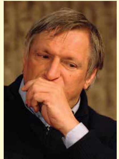
DON LUIGI CIOTTI A TRENTO NEL 2011. JAQEN (NICCOLÒ CARANTI) - OPERA PROPRIA - CC BY-SA 3.0 LUIGI CIOTTI ALLA SALA DELLA COOPERAZIONE A TRENTO PER UN INCONTRO SULLA LOTTA ALLE MAFIE.

■ 2013 - in gennaio, le associazioni che presiede (Libera e Gruppo Abele) avviano la campagna online di Riparte il futuro, che ha permesso la modifica dell'articolo 416 ter del codice penale in tema di voto di scambio politico - mafioso il 16 aprile 2014. (fonte wikipedia)