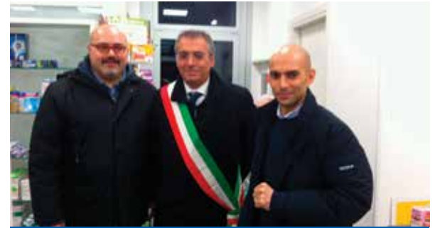
PARAFARMACIA DEI CEDRI