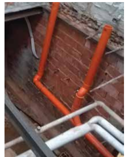
SCUOLA PRIMARIA "CALAMANDREI"

Con intervento in economia (cioè eseguito direttamente dal personale dipendente del Comune), si è completato anche il ripristino dell'area scolastica esterna, dove, in passato, sono stati segnalati ristagni d'acqua piovana e perdite dell'impianto idrico. L'intervento ha comporta-