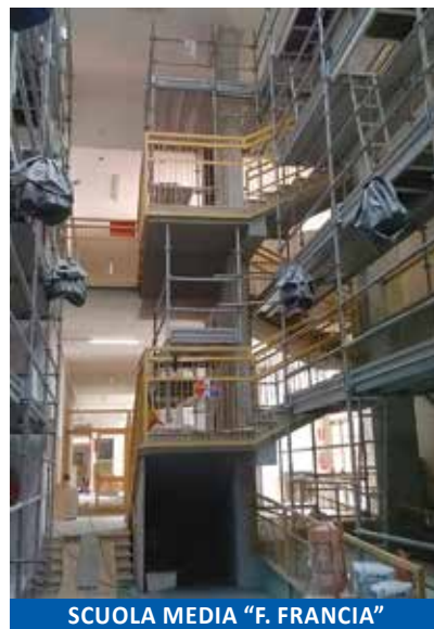
SCUOLA MEDIA "F. FRANZIA"